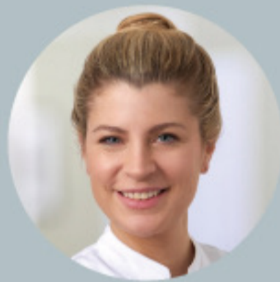
Dr. Jungclaus Dermatologin