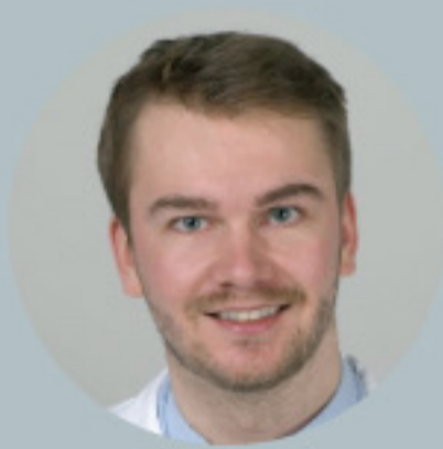
Dr. Greis Dermatologe